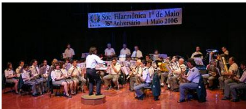
Actuação no dia 1 de Maio de 2006, no Centro Cultural de Lagos

No que concerne à distribuição dos instrumentistas pelo tipo ou naipe de instrumentos, a composição da Banda inclui 13 clarinetes, 1 saxofone soprano, 2 saxofones altos, 2 saxofones tenor, 4 trompetes, 1 fliscorne, 1 trompa, 2 bombardinos, 3 trombones, 1 tuba, 6 percussionistas. Porém, o património instrumental da associação é bem mais vasto. Entre instrumentos operacionais e, temporariamente, inoperacionais existem: 1 flautim, 6 flautas, 1 requinta, 17 clarinetes, 2 sax sopranos, 10 sax altos, 7 sax tenores, 2 sax barítonos, 10 trompetes, 7 fliscornes, 1 sax trompa, 3 claricorns, 3 bombardinos, 1 trombone pistões, 6 trombones de varas, 4 contrabaixos, 2 tubas, 1 lira, 2 baterias e diverso material de percussão.