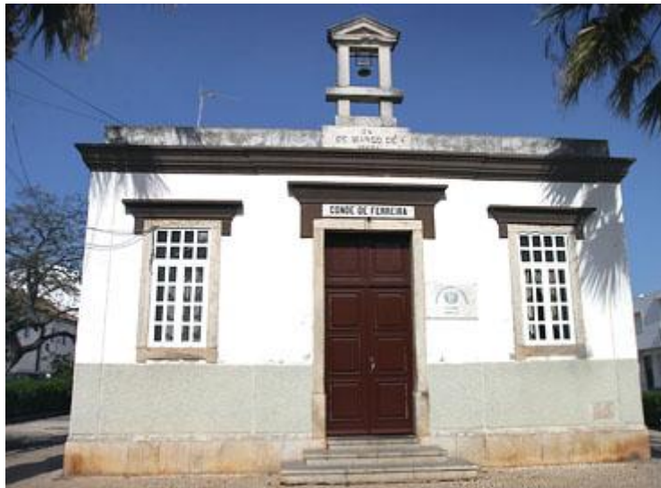
Fachada da actual sede, a antiga Escola Primária Conde Ferreira

apenas uma sanduíche de moreia, à laia de “mata-bicho”. Ir à Filarmónica “comer uma bucha” fora pois, a sua principal preocupação, logo ao saltar para terra, depois de uma noite na faina do mar.