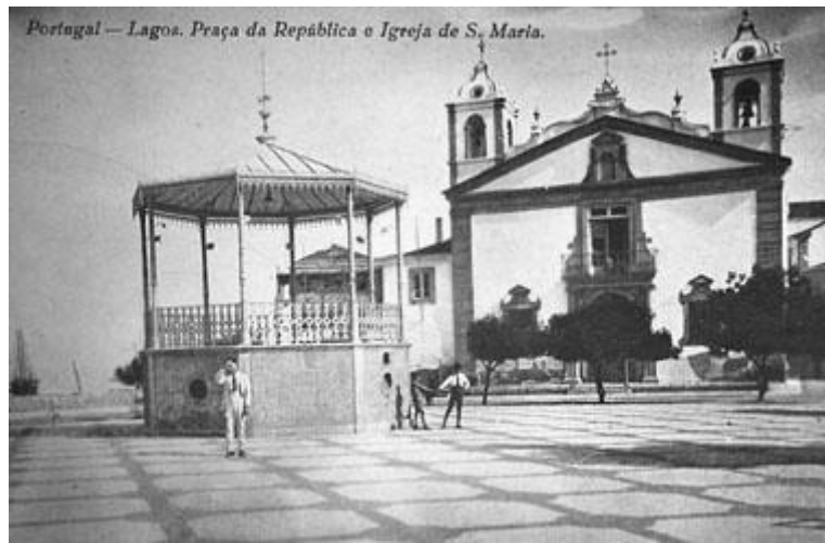
Coreto antigo existente na Praça da Música

O primeiro coreto, construído com base em alvenaria e superestrutura metálica, de dimensões mais modestas que o segundo, terá sido destruído antes da formação da S.F.L. 1º de Maio para dar lugar ao novo coreto, construído no mesmo material mas maior, mais alto, e com mais espaço para receber a banda e guardar apetrechos no seu interior. Infelizmente, a construção da avenida marginal e a colocação da estátua do Príncipe Navegador, em 1960, terão justificado a remoção do simpático coreto que, assim, desapareceu para sempre.