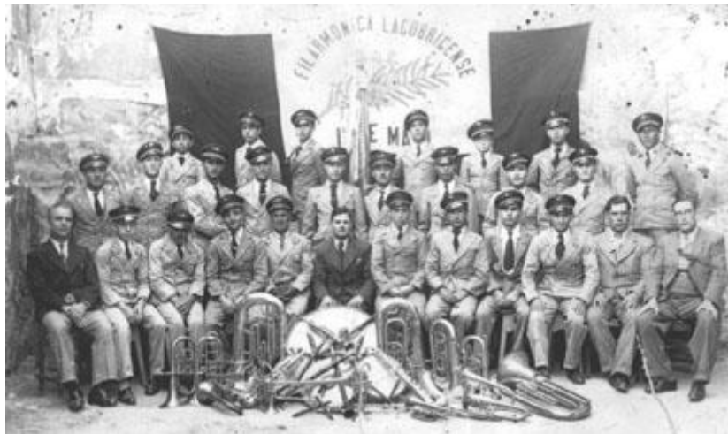
A Banda da S.F.L. 1º de Maio em meados dos anos 30

A S.F.L. 1º de Maio foi reconhecida como Colectividade de Utilidade Pública em 17 de Setembro de 1988 e foi agraciada com a Medalha de Mérito Municipal – Grau Prata, em 27 de Outubro de 1991 como reconhecimento pelo seu trabalho no âmbito sócio-cultural. Em 1 de Maio de 2006, ao completar 75 anos de existência recebeu a Medalha de Mérito Associativo – Grau Prata, atribuída pela Confederação Portuguesa das Colectividades de Cultura, Recreio e Desporto, da qual é associada.