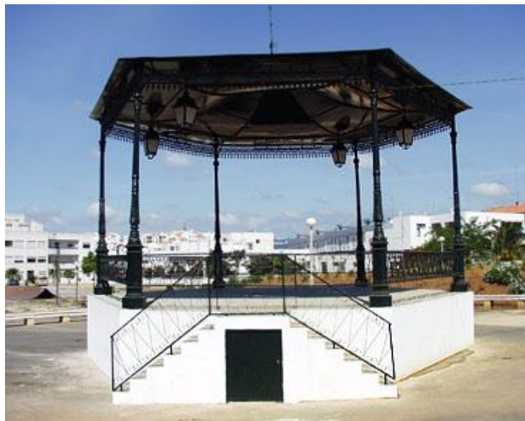
O coreto actual, situado nas proximidades da localização da futura sede da S.F.L.

No primeiro ano do novo milénio Lagos inaugurou um coreto, de construção modesta e localização deficiente, não obstante situar-se num pequeno parque urbano adjacente à artéria da cidade que ostenta o nome da filarmónica local e para onde se prevê a implantação da futura sede da Associação.